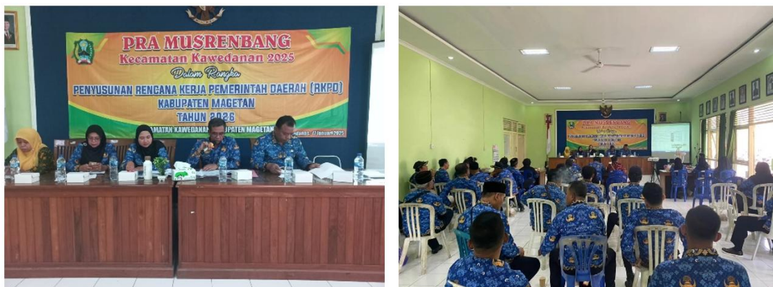
Gambar 2. Pemingkatan pra-musrenbang

Prinsip kesetaraan dalam Musrenbang Kecamatan Kawedanan diwujudkan melalui mekanisme yang memberikan kesempatan kepada seluruh peserta untuk menyampaikan pendapat, meskipun tidak diterapkan pembagian waktu bicara secara kaku. Berdasarkan hasil wawancara, penyaringan usulan telah dilakukan sejak tingkat desa melalui musyawarah RT, RW, dan desa, sehingga ketika memasuki forum kecamatan, usulan yang dibahas merupakan hasil penetapan skala prioritas. Proses ini memungkinkan diskusi berjalan lebih efektif sekaligus tetap memberi ruang kepada setiap perwakilan desa untuk memaparkan kebutuhan masyarakatnya tanpa harus dibatasi durasi tertentu, sehingga suasana musyawarah tetap terbuka dan partisipatif.