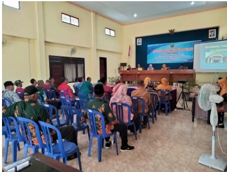
Gambar 1. Pemaparan Kelurahan/Desa

kesetaraan menjadi salah satu indikator penting dalam menilai kualitas proses deliberatif dalam Musrenbang tingkat kecamatan.