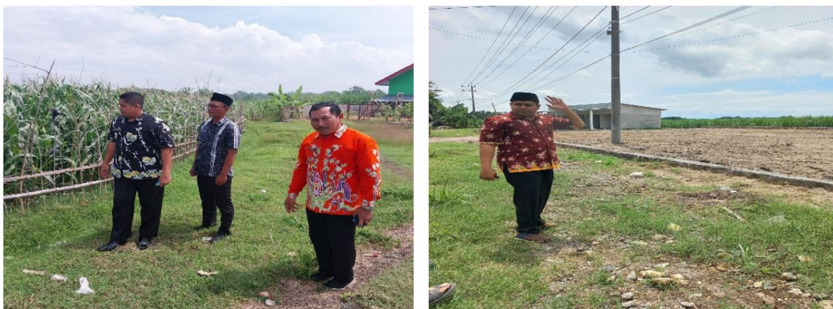
Gambar 3. Survei Lokasi oleh Sekcam dan Kasi PMD